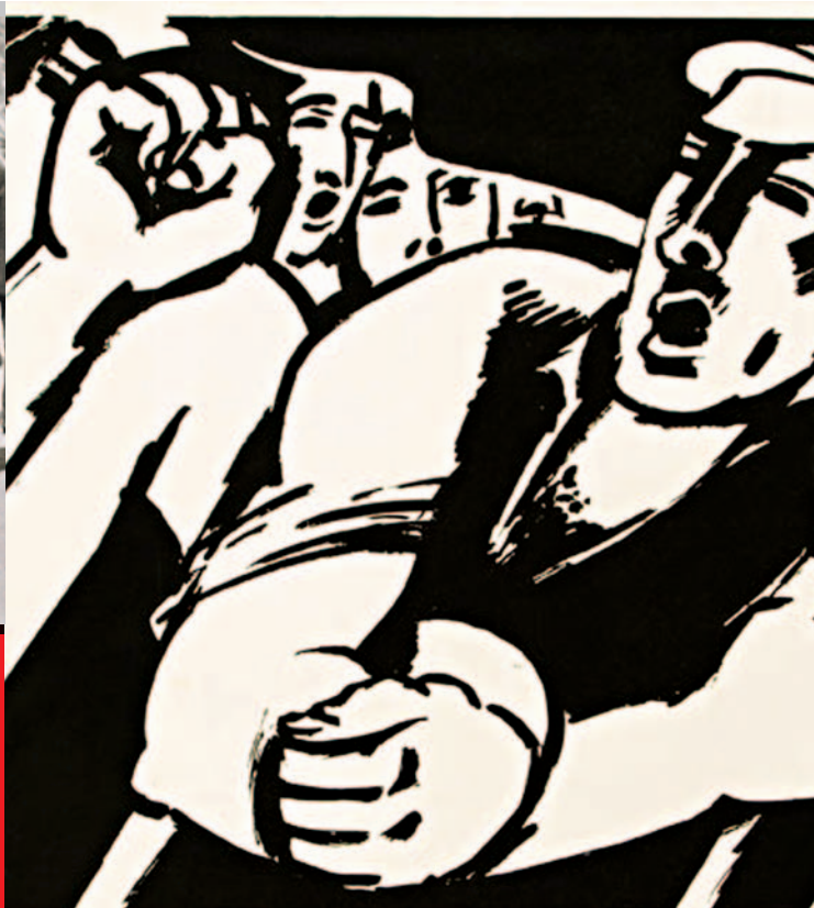
Linogravure: Louis Deltour

La Centrale Générale fête son centenaire, mais l'exposition débute 200 ans auparavant, aux sources de notre histoire sociale.